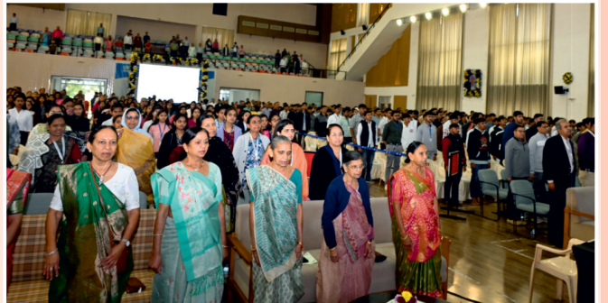
સમારોહ પૂર્ણ થતાં રાષ્ટ્રગીત ગાનનાં બે દશ્યો ....