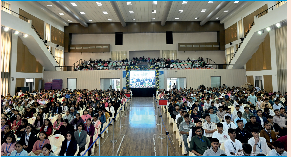
श्री माझेकलाल ऐम. पटेल मेमोरिअल मेरिट स्कूलरशिप ऐनायत सडारोड प्रसंगे सडडडडडडनुं डडशु