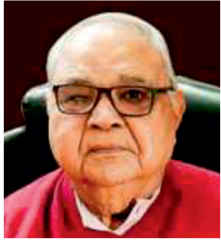
પદ્મશ્રી ચંદ્રકાન્ત સોમપુરા