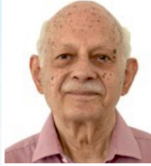
પદ્મશ્રી રતનકુમાર પરીમુ