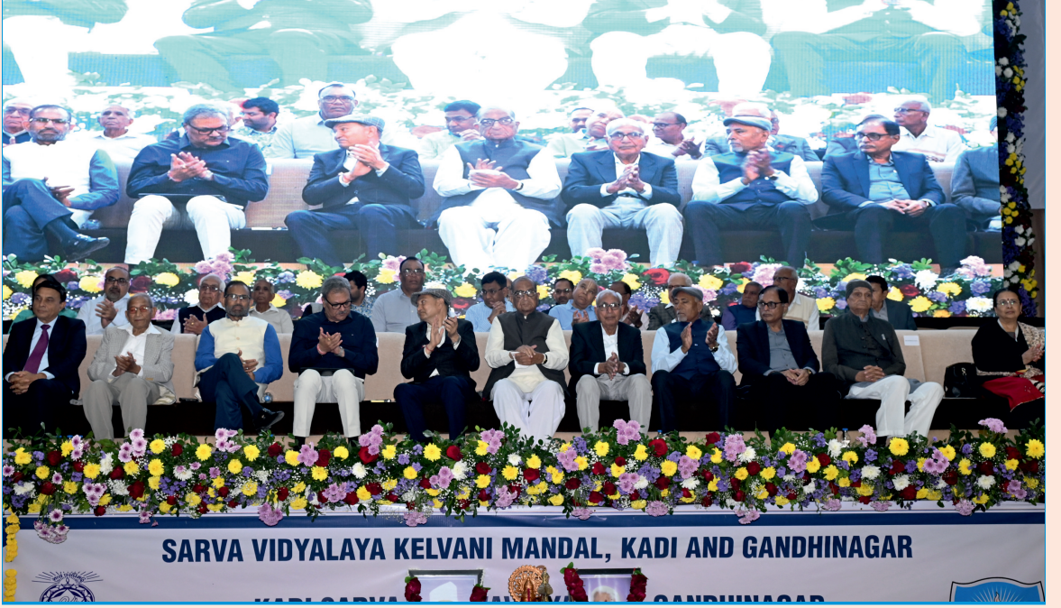
श्री माझेकलाल ऐम. पटेल मेमोरिअल मेरिट स्कूलरशिप ऐनायत सडारोड प्रसंगे डंयस्थ डडानुडडडवो.