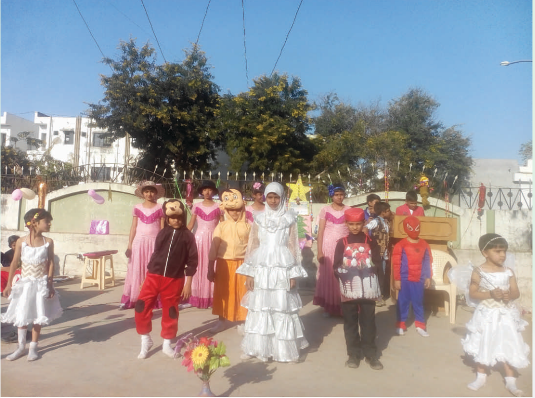
શ્રી જે. બી. પ્રાથમિક શાળા, ગાંધીનગર દ્વારા આયોજિત બાલોત્સવનું એક દ્રશ્ય