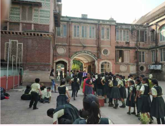
એસ. જી. અંગ્રેજી માધ્યમ પ્રાથમિક શાળા, ગાંધીનગરનાં વિદ્યાર્થીઓએ વડોદરાના પ્રવાસ દરમ્યાન મ્યુઝિયમ, કમાટીબાગ વગેરેની મુલાકાત લીધી તેનાં બે દ્રશ્યો.