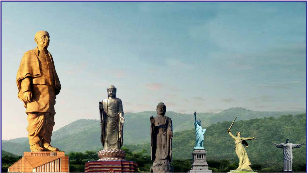
STATUE OF UNITY GUJARAT, INDIA 182 MTS

Printed by : Sharda Mudranalaya, 201, Tilakraj, Panchwati 1st lane, Ambawadi, Ahmedabad-6