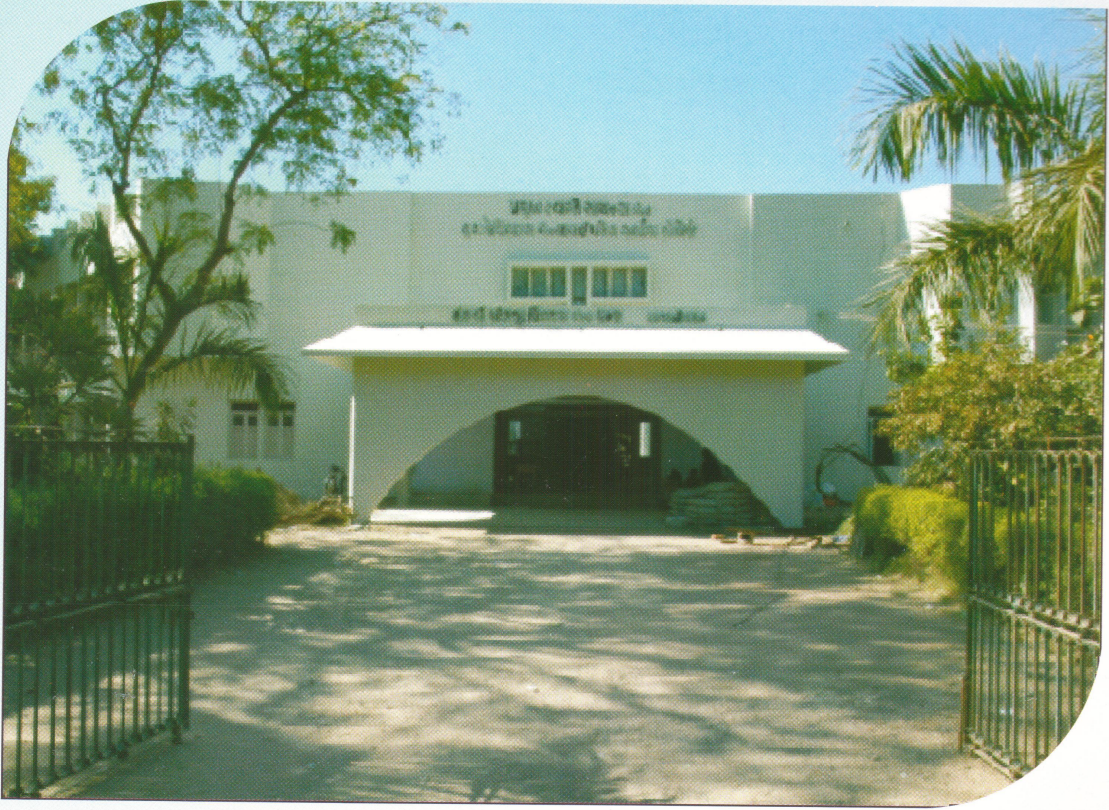
પ્રમુખસ્વામી સાયન્સ એન્ડ એચ. ડી. પટેલ આર્ટ્સ કોલેજ, કડી