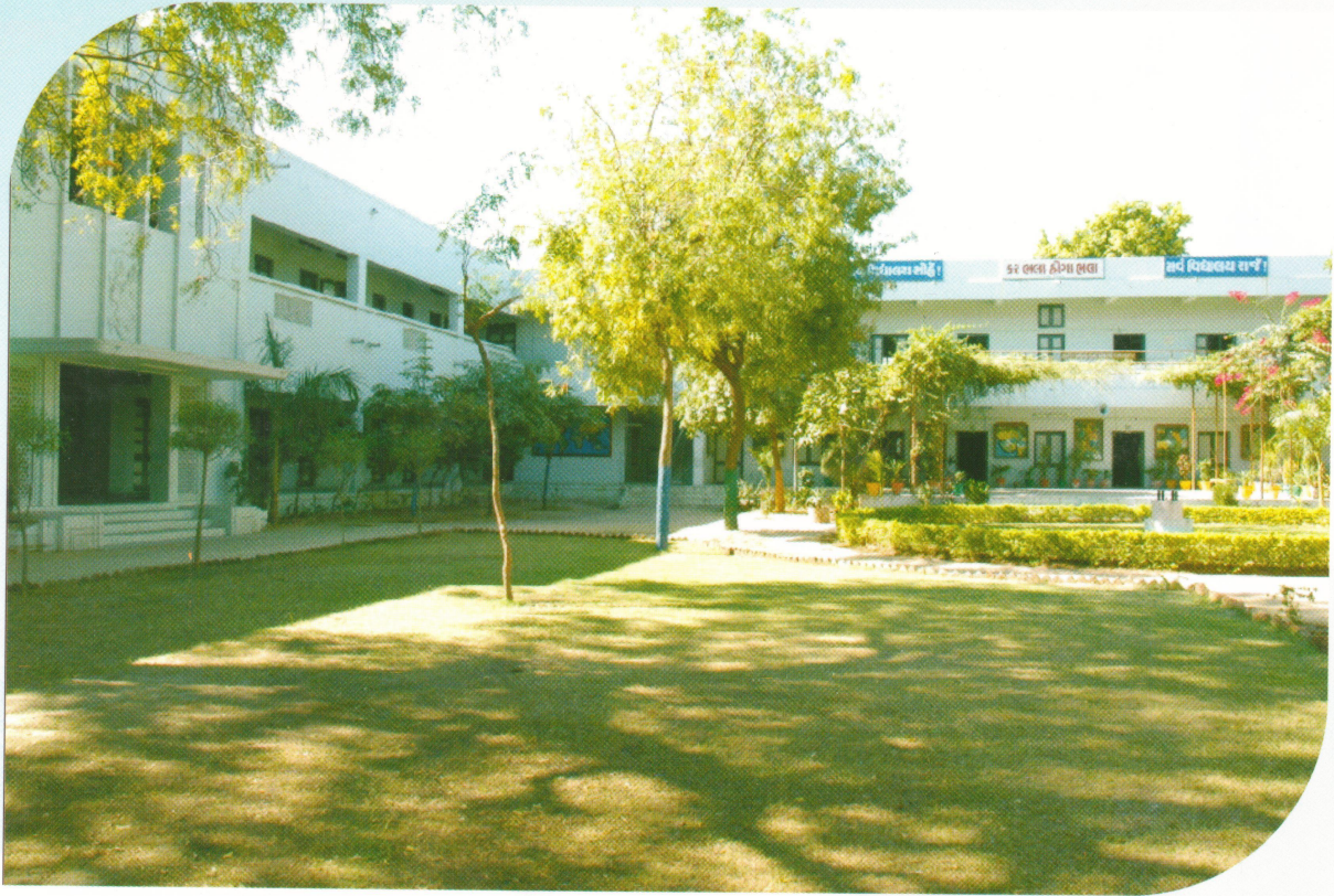
સર્વ વિદ્યાલય, કડી

Published by Registrar, Kadi Sarva Vishwavidyalaya, Sector-15, L.D.R.P. Engineering College Campus, Gandhinagar-382015