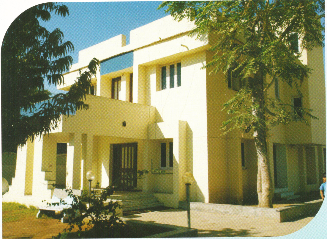
સર્વ વિદ્યાલય કેળવણી મંડળ કાર્યાલય, ગાંધીનગર