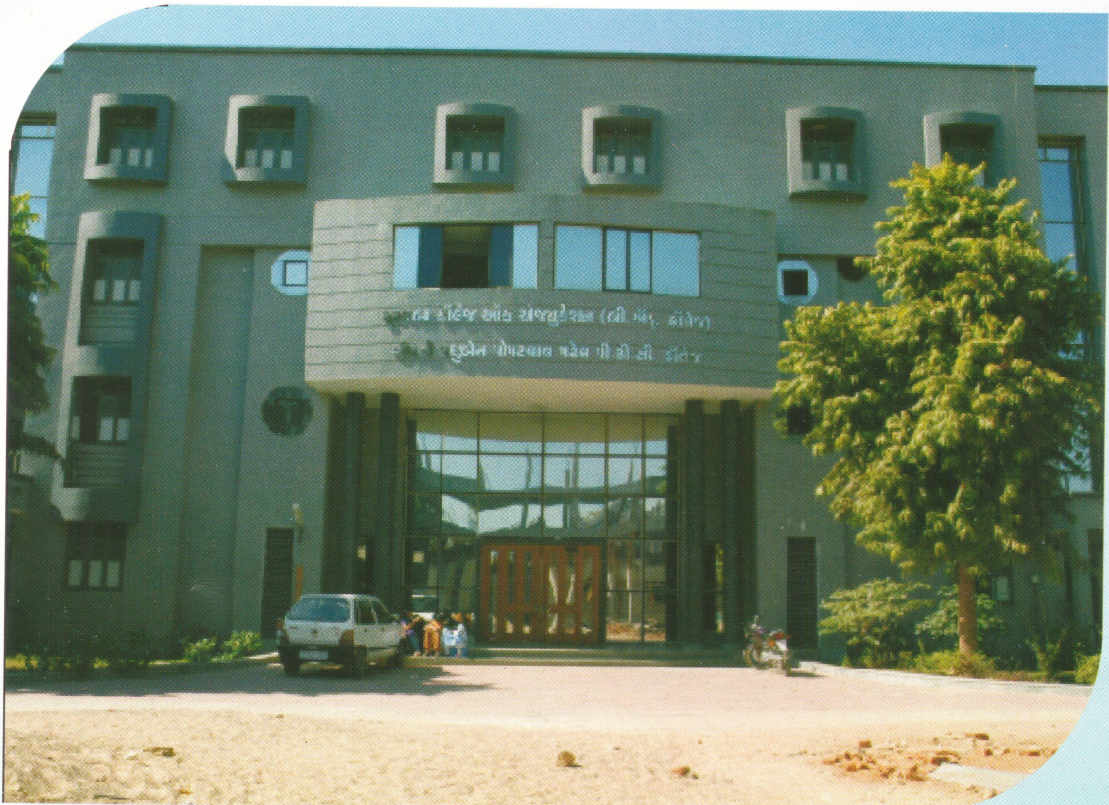
સૂરજબા કોલેજ ઓફ એજ્યુકેશન, કડી