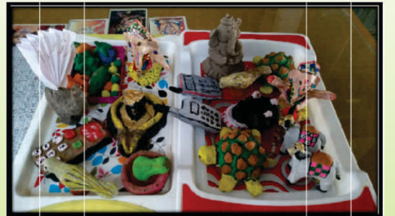
શ્રી કડી નાગરિક સહકારી બેંક દ્વારા આયોજિત સર્જનાત્મક કૌશલ્યની તાલીમનાં બે દ્રશ્યો.