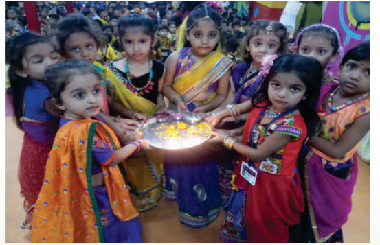
મેઘના નિરંજન શિશુ વિદ્યાવિહાર, કડી દ્વારા આયોજિત ગુરુપૂર્ણિમા અને ગૌરીવ્રતની ઉજવણીનું દ્રશ્ય.