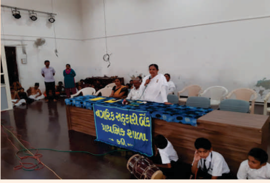
શ્રી કડી નાગરિક સહકારી બેંક પ્રાથમિક શાળા દ્વારા આયોજિત ગુરુપૂર્ણિમા પર્વ પ્રસંગે રાજયોગિની સંગીતાદીદી ગુરુમહાત્મ્ય વિશે ઉદ્બોધન કરી રહ્યાં છે તથા 'એકલવ્ય' નાટિકાનું દ્રશ્ય.