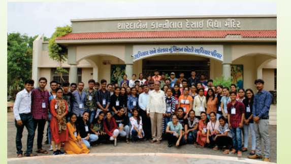
કડી સર્વ વિશ્વવિદ્યાલય, ગાંધીનગર દ્વારા આયોજિત ૪૮મી 'સર્વ નેતૃત્વ તાલીમ શિબિર'ના શિબિરાર્થીઓ...