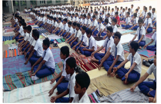
શ્રી જે. બી. પ્રાથમિક શાળા દ્વારા આયોજિત વિષય યોગદિનની ઉજવણીનું દ્રશ્ય.