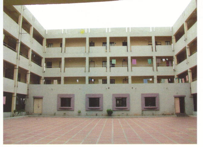
ઉચ્ચ શિક્ષણ બોર્ડિંગ હોસ્ટેલ, સેક્ટર-15, ગાંધીનગરનું અંદરનું દૃશ્ય