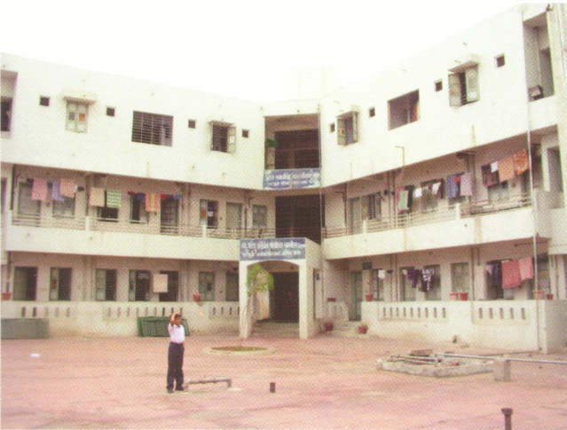
પટેલ અમથીબેન રેવનદાસ શિવદાસ ઉમિયા કુમાર છાત્રાલય, સ્વ. પટેલ ડાહીબેન ભોળીદાસ અમથીદાસ ઉમિયા કુમાર છાત્રાલય, સેક્ટર-23, ગાંધીનગર