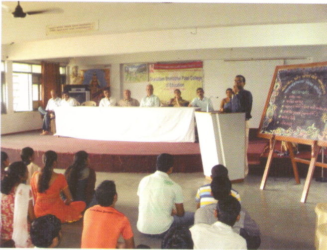
એસ. એસ. પટેલ કોલેજ ઓફ એજ્યુકેશન, ગાંધીનગર દ્વારા આયોજિત આચાર્યશ્રીઓનું સ્નેહમિલન