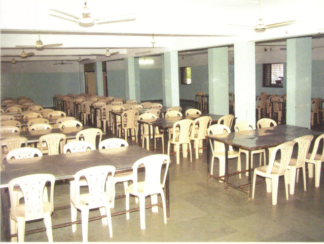
ઉચ્ચ શિક્ષણ બોર્ડિંગ હોસ્ટેલ, સેક્ટર-15નું ભોજનાલય