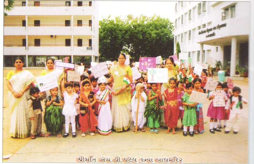
ડીરાબહેન વિકલભાઈ પટેલ કન્યા બાલમંદિર ગાંધીનગર દ્વારા આયોજિત શાળા પ્રવેશોત્સવનું એક દશ્ય