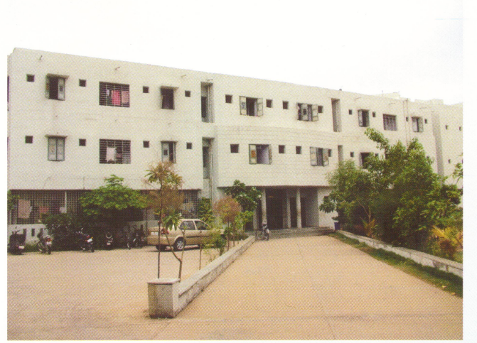
સર્વ વિદ્યાલય ઉચ્ચ શિક્ષણ ઉમિયા કુમાર છાત્રાલય, સેક્ટર-23, ગાંધીનગર