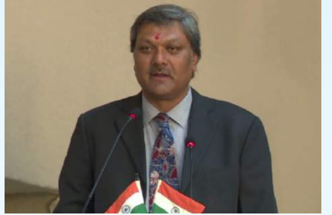
આભારવિધિ કરી રહેલા શ્રી વલ્લભભાઈ પટેલ