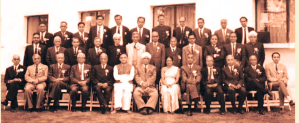
Group photo taken at the 1968 Annual Meeting of IASc in Ahmedabad. Celebrating Raman's 80th birthday.