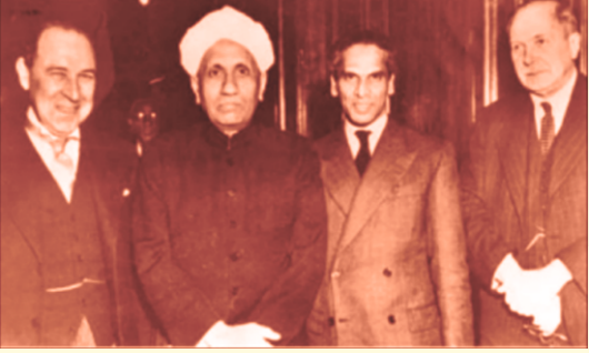
Sir John Anderson, C. V. Raman, V. K. Krishna Menon and Sir Charles Darwin at a reception in honour of Raman by the High Commissioner in London, May 11, 1948.