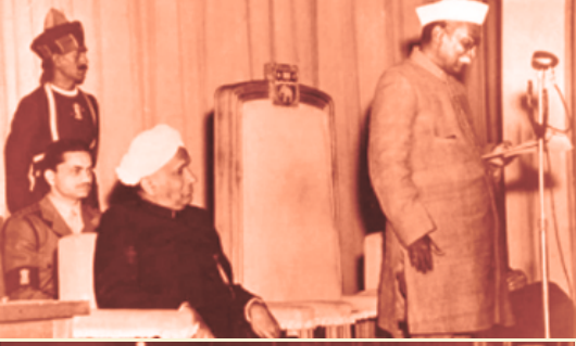
President Rajendra Prasad inaugurates the Seventeenth Annual Meeting of the Indian Academy of Sciences on December 27, 1951 in Delhi. Raman is seated on the left.