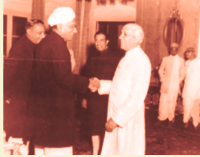
Prime Minister Nehru and C. V. Raman, with K. Hanumanthayya, Chief Minister of Karnataka, in the center. Picture taken at the residency in Bangalore circa 1957.