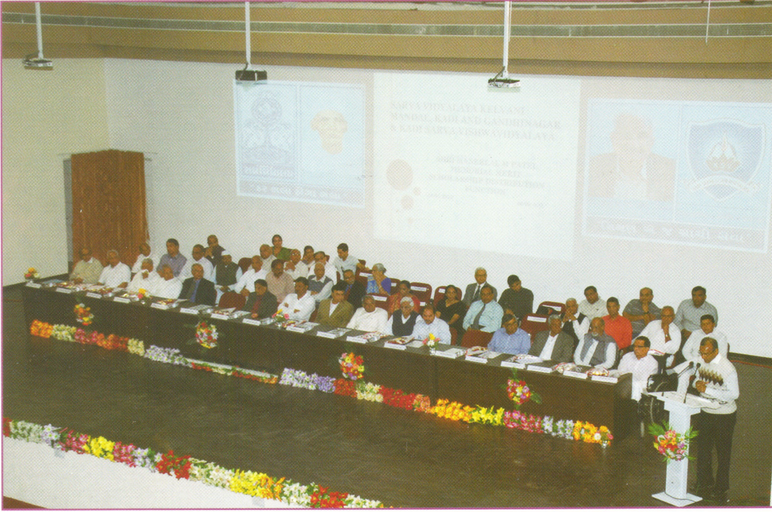
તા. 12-1-2013ના રોજ આયોજિત માણેકલાલ એમ. પટેલ મેમોરિઅલ મેરિટ સ્કોલરશિપ એનાયત સમારોહ પ્રસંગે ઉપસ્થિત મંચસ્થ મહાનુભાવો.